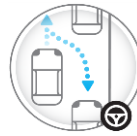
Intelligent Auto Parkering