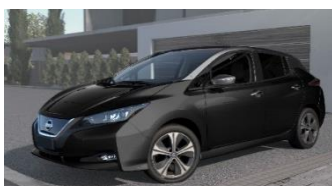
XDK Black & Dark Metal Grey