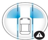
Varsel for kryssende trafikk foran og bak