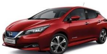
NAJ Magnetic Red Metallic