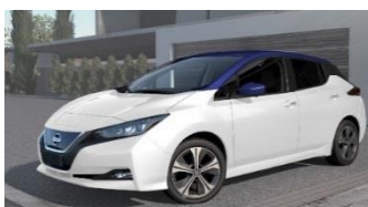
XDH Pearl White & Ink Blue