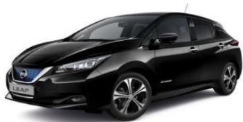
Z11 Black Metallic