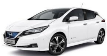
326 White Solid