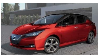
XDS Magnetic Red & Black