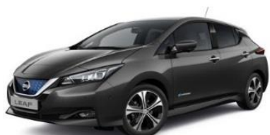
KAD Dark Metal Grey Metallic