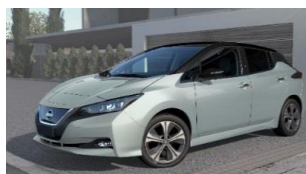
XDG Spring Cloud & Black