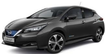
KAD Dark Metal Grey Metallic