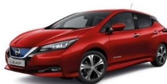
Z10 Red Solid