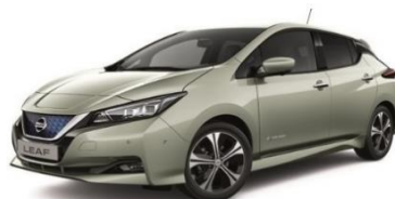
KBR Spring Cloud Metallic