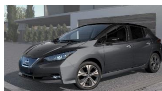
XDJ Dark Metal Grey & Black