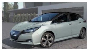
XDG Spring Cloud & Black