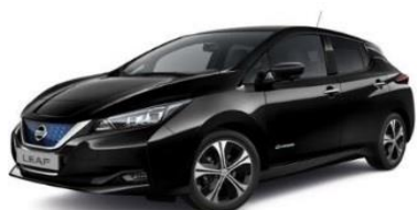
Z11 Black Metallic