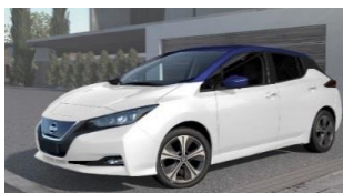
XDH Pearl White & Ink Blue