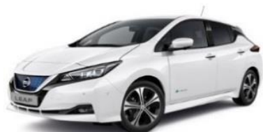
QAB Pearl White Pearl