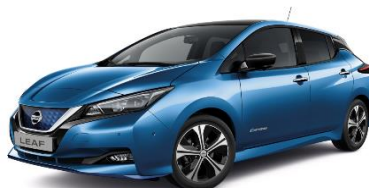
RCA Vivid Blue Metallic

* Farger og fargekombinasjoner i brosjyren kan avvike fra virkelige farger på bilene