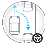
Intelligent Auto Parkering