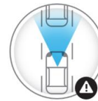
Forvarsel om kollisjonsfare