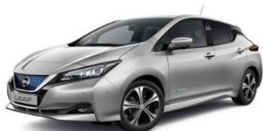
KYO Silver Metallic