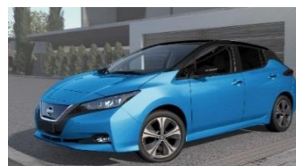
XDY Vivid Blue & Black