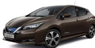
CAN Chestnut Bronze Metallic