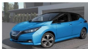
XDY Vivid Blue & Black