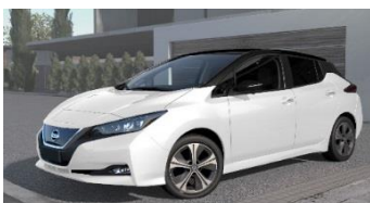
XDF Pearl White & Black