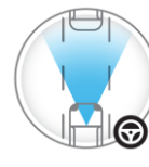
Intelligent cruisekontroll og trafikkork pilot